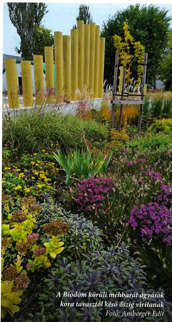
A Biodóm körüli méhbarát ágyások kora tavasztól késő őszi virítanak