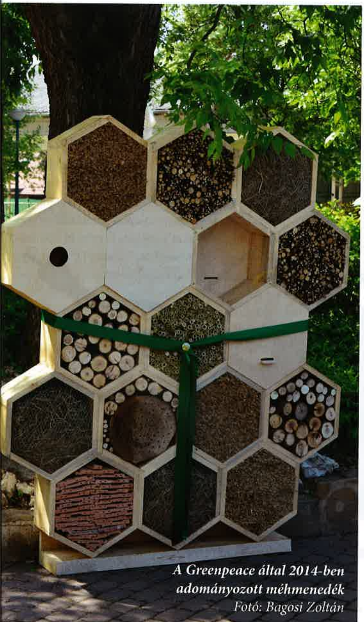
A Greenpeace által 2014-ben adományozott méhmenedék